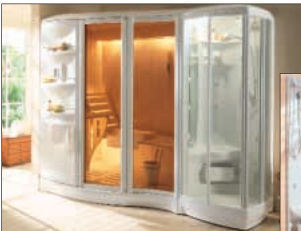
Doc Van Marcke

Si vous construisez votre douche, prévoyez 6 jets vis-à-vis dans les parois de la cabine pour vous procurer une douche vraiment tonifiante. Si votre douche est existante, il est toujours possible d'installer une colonne d'hydromassage pour douche qui rassemble tous les éléments. Il existe également des cabines de douche complètes avec le système hydromassage incorporé. Une alimentation, une évacuation à portée de mains et le tour est joué. Le 'must' est la même cabine avec sauna incorporé.