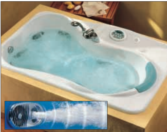
Doc. Van Marcke

Avec les baignoires balnéo, vous allez découvrir ce qu'est la vraie détente.