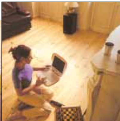
GPL - Pin des Landes