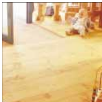
HOEBEEK - Mélèze