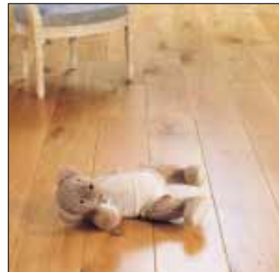
PMO - Chêne rustique.