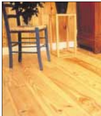
C&D - Pin des Landes

Les 14mm pourront dans certains cas être placés en pose flottante, tandis que les 18 mm/+ autoriseront la pose clouée en adaptant l'entre-axe des supports en fonction de l'épaisseur du parquet.