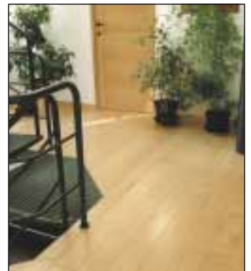
Hoebek - Erable