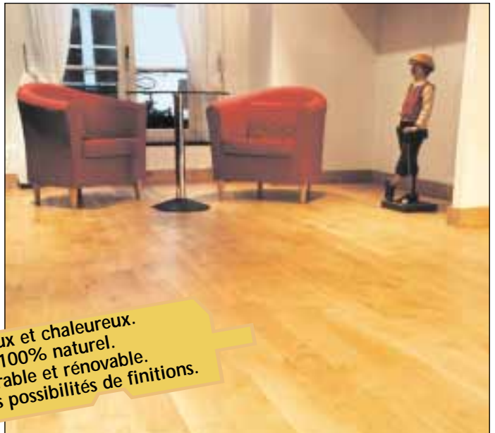
PMO - Chêne rustique large

Doux et chaleureux. 100% naturel. Durable et renouvelable. Multiples possibilités de finitions.