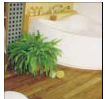
HOEBEEK - Tek