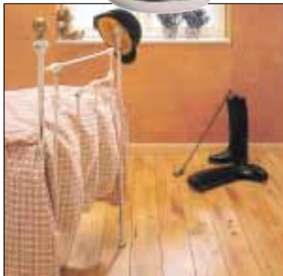
Junckers - Hêtre