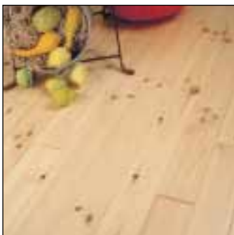
HOEBEEK - Sapin rouge du Nord

Doux et chaleureux. 100% naturel. Durable et renouvelable. Multiples possibilités de finitions.