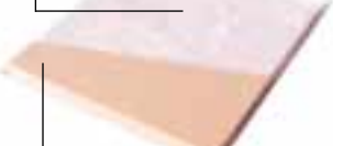
Matériel de base MDF E1 hydrofuge