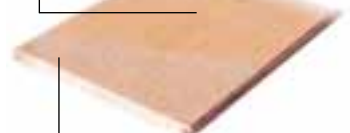
Matériel de base aggloméré V20 E1

Surface synthétique de grande qualité (surface mélaminée)