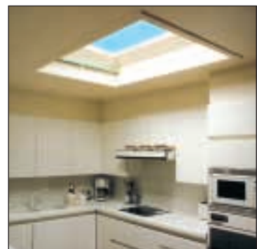
Doc. AG PLASTICS